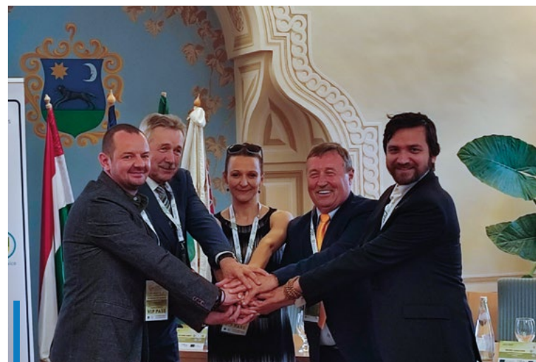
Hét évre szóló megállapodást pecsételt meg a kézfogás

A kezdeményezésen belül megvalósuló program célja, hogy az európai demokratikus értékeket közelebb hozza a polgárokhoz, az együttműködő partnerek megismerjék egymás hagyományait, és alapot teremtsen többirányú, hosszabb távú együttműködéseknek. A hat konzorciumi partner a közel két év alatt megvalósuló program során összesen tíz alkalommal találkozik. A projekt első állomásának Gyöngyös ad otthont, ahol valamennyi partnertelepülés delegációja bemutatkozik.