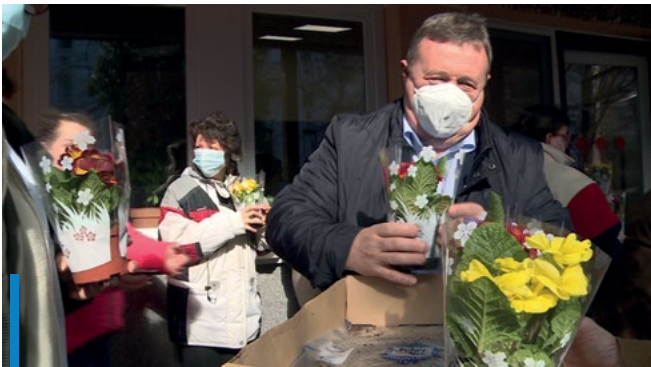
Köszönet a jóságért és a kedvességért

A hölgyeket köszöntötte Nőnap alkalmából Hiesz György polgármester. A városvezető virágot ajándékozott a város nevében a Kistérségi Humán Szolgáltató Központ intézményeiben lévő hölgyeknek. Hiesz György elmondta, ezen a napon kiemelt figyelem illeti a nőket. Köszönetet mondott "mindazért a jóságért és kedvességért amivel csak a hölgyek rendelkeznek". A Nőnap alkalmából rendezett városi ünnepségen az Operett-Musical Voices Társulat szórakoztatta a vendégeket, akiket Dudás Róbert, az Egységben Magyarországért országgyűlési képviselőjelöltje köszöntött.