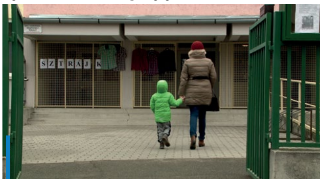
Van olyan iskola, ahol szinte kivétel nélkül támogatják a szülőket a sztrájkot

A gyöngyösi iskolák közül a II. Rákóczi Ferenc Katolikus Általános Iskola és Alapfokú Művészetoktatási Intézmény, a Berze Nagy János Gimnázium, az Arany János Általános Iskola, az Egressy Béni Két Tanítási Nyelvű Általános Iskola, a Felsővárosi Általános Iskola és Gyöngyösi Kálváriaparti Sport- és Általános Iskola is részt vesz a sztrájkban. A felsorolt intézmények között van, ahol a szülői közösség szinte 100%-ban kiáll a pedagógusok tiltakozása mellett.