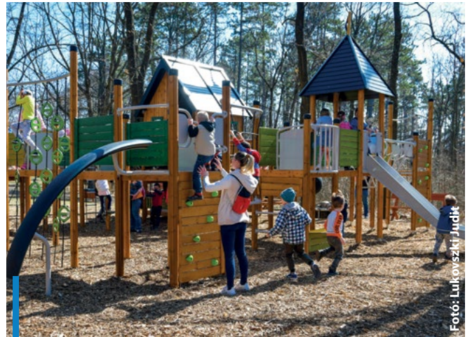
Minden korosztályt kielégítő parkerdő várja a vendégeket Mátrafüreden

Elkészült a mátrafüredi parkerdő fejlesztése. A 2500 négyzetméteres területen megvalósult beruházás részeként kialakítottak két tematikus játszótérrel, egy erdei tornapályát és egy erdei tanösvényt. A projekt teljes költsége csaknem 90 millió forint, melyhez több mint tízmillió milliárd forint önerőt biztosított a város képviselő-testülete a csaknem 67 millió forintos támogatás mellé. Az újak mellett megmaradt a régi játszótér is, hogy a fejlesztésnek köszönhetően minden korosztályt kielégítő parkerdő legyen Mátrafüreden.