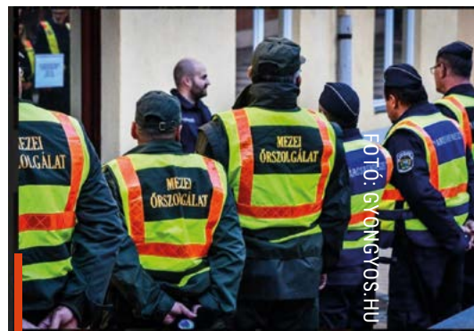
A városrendészek és a mezőőrök is költöznek

Az ügyfelek továbbra is a 06 37 303-351-es telefonszámon, a rendeszet@gyongyos-ph.hu e-mail címen és közösségi oldalon érik el a szervezetet.