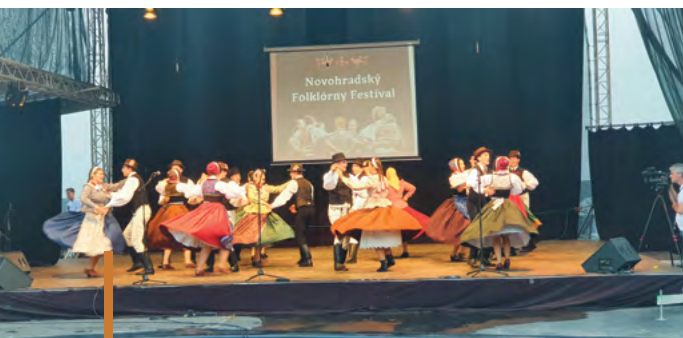
Nagy sikert aratott a Vidróczi Néptáncgyűttes a nógrádi fesztiválon

Július utolsó hétvégén Losoncra látogatott a gyöngyösi önkormányzat és a Mátrai Hegyközségek Nonprofit Kft. közös delegációja. A látogatásra Mátrai Hegyközségek Nonprofit