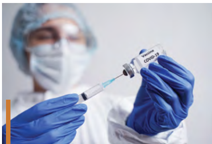
Már Gyöngyösön, a Bugát Pál Kórházban is meg lehet kapni a harmadik oltást

A harmadik oltás beadása különösen ajánlott az időseknek, a krónikus betegségben szenvedőknek, és a legyengült immunrend-