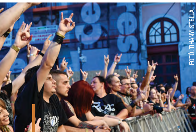
FOTÓ: TIHANYI STELLA

A Road zenekar koncertjére zsúfolásig megtelt a Fő tér képgaléria: gyongyos.hu