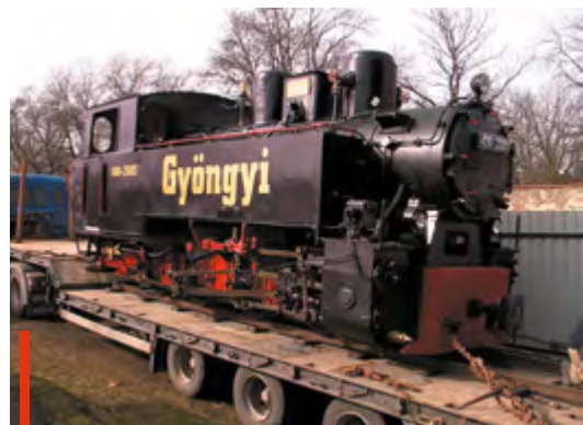
Sikeres próbafűtés után áll szolgálatba március idusán Gyöngy, a gőzmozdony