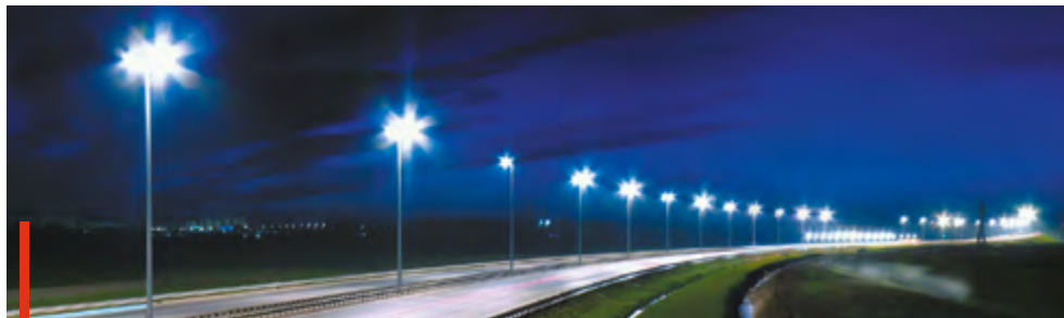
A korszerű, energiatakarékos világításra felvett hitel rövid idő alatt megtérül (képünk illusztráció)