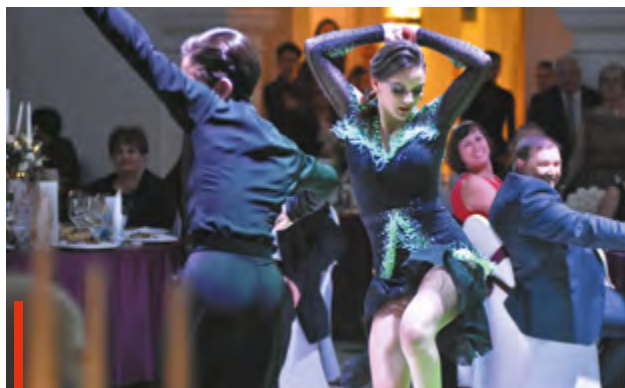
A bálózókat főként helyi tehetséges zenészek és táncosok szórakoztatták

A bálon, melynek idén is a Mátraaljai Munkaadók Egyesülete volt a társszervezője, a vacsorafogások mellé a város és a térség borászainak kiváló borait szolgálták fel. A