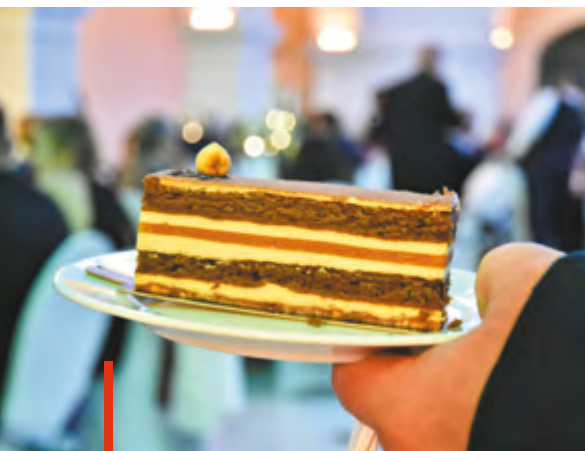
Sárgabarack és mogyoró a legfontosabb alkotóeleme az első várostortának

Azt szeretnék, hogy minél többen megismerjék az édességet, ezért nem akarja hétecsés titokként őrizni a torta receptjét. A receptúrát bármelyik gyöngyösi cukrászdával szívesen megosztja, amelyik szeretné süteményei között kínálni Gyöngyös első tortáját.