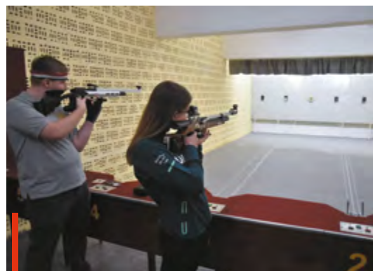
Az új lőtér országos versenyek megrendezésére is alkalmas