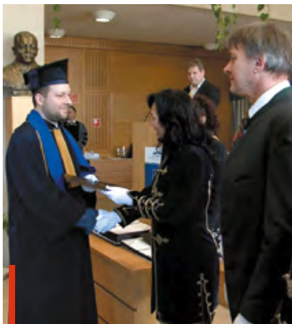
Az immár diplomával rendelkezők csaknem fele mesterszakon folytatja tanulmányait a campuson

A diplomaosztón a KÁ-RÓ Színkör tagjai is elbúcsúztak a diákoktól. Az ünnepségen, a hagyományokhoz hűen a végzős hallgatók fogadalmat tettek. Ollé Elina