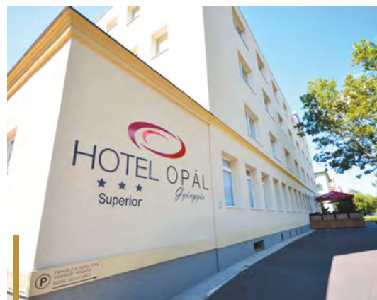
Nem csak a szállóvendégeket, a gyöngyösieket is várja a város egyetlen szállodája

A szálloda szolgáltatásaival nem csak vendégei elégedettségére törekszik, hanem Gyöngyös jó hírnevéhez méltó módon igyekszik a várost képviselni.