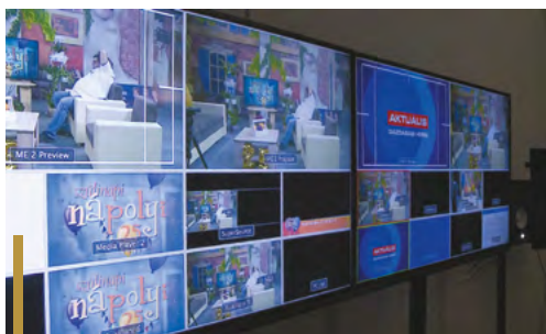
A városi televízió dolgozói ünnepi adással kedveskedtek a nézőknek a GYTV születésnapja alkalmából

Az idén huszonöt éves Gyöngyösi Televízió (GYTV) különleges, egész estés születésnapi adással jelentkezt Nápolyi című műsorában november közepén. Az este során számos emlékeztető pillanatot elevenítettek fel, volt bakiparádé, játék és sztárvendég is el látogattak a stúdióba.