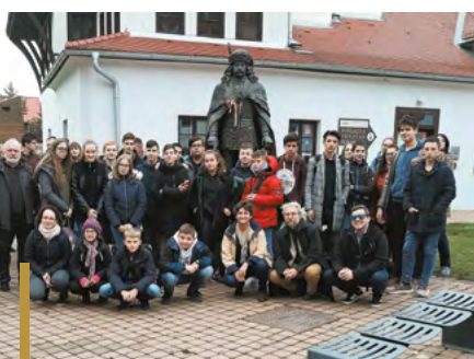
A diákok II. Rákóczi Ferenc koráról adtak számot

Az idei városi helytörténeti vetélkedőn II. Rákóczi Ferenc munkásságáról, életéről, valamint a kora jelentősebb gyöngyösi eseményeiről kellett a diákoknak számot adniuk. A Vachott Sándor Városi Könyvtárban megrendezett versenyre, öt helyi általános és hat középiskolás csapat nevezett. A megmérettetésen villámkérdések, totó és megannyi izgalmas és érdekes feladat várta a diákokat.